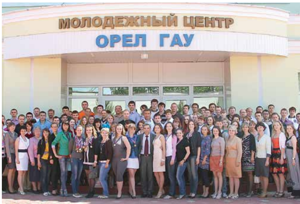
Этого момента студенты и преподаватели Орловского государственного аграрного университета ждали несколько лет.