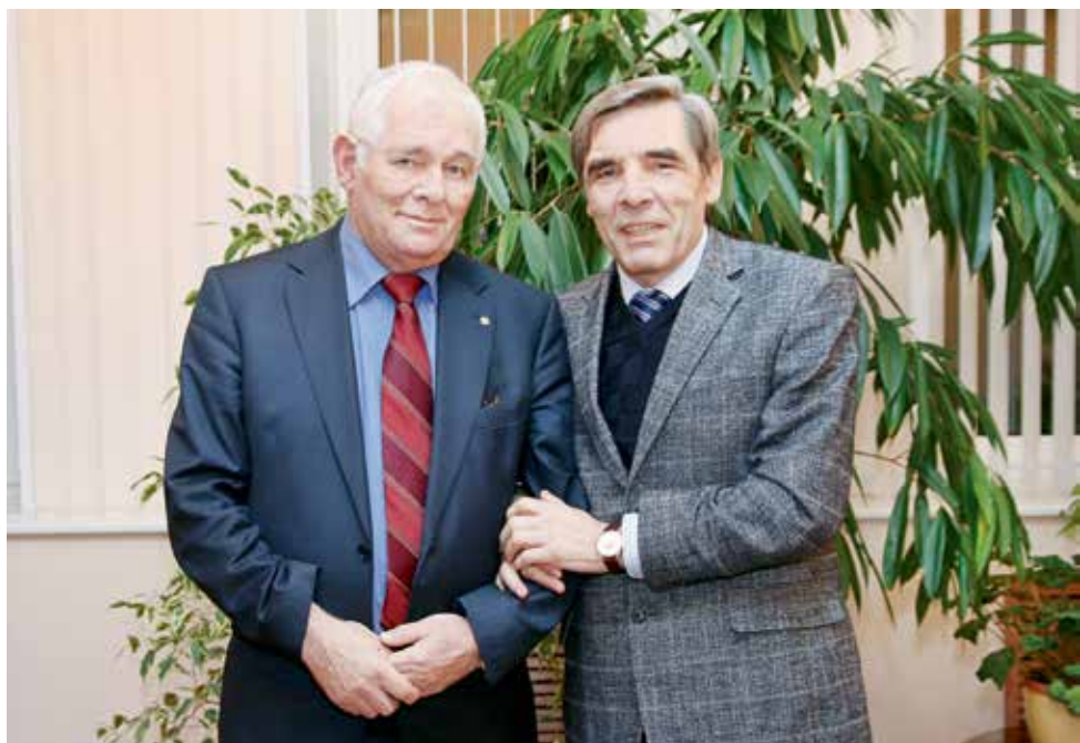
Патриоты своей страны – доктор Рошаль и академик Парахин.