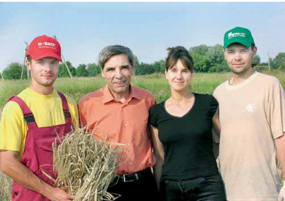
Студенческие уборочные отряды ОГАУ активно помогли сельхозпредприятиям в уборке урожая.