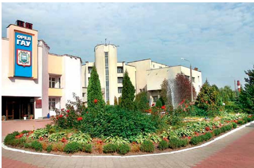
Главный корпус университета, который теперь носит имя Н. В. Парахина.