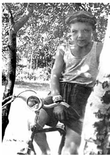
Велосипед – транспорт детства.