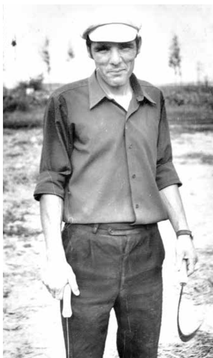
Когда-то и серп был важным орудием труда.