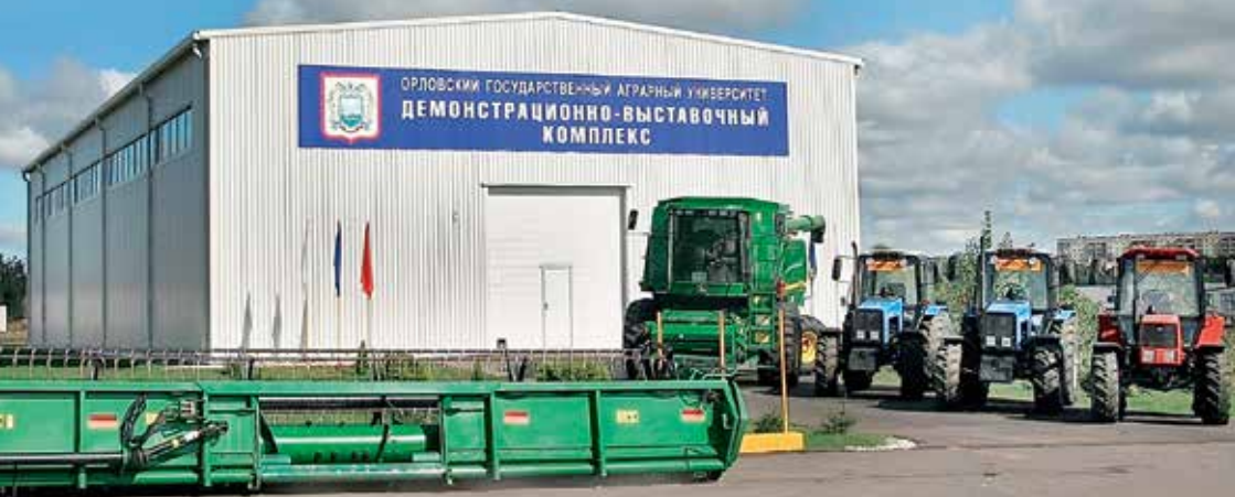
Демонстрационно-выставочный центр ОГАУ – это прежде всего учебная площадка для подготовки молодых специалистов для села.