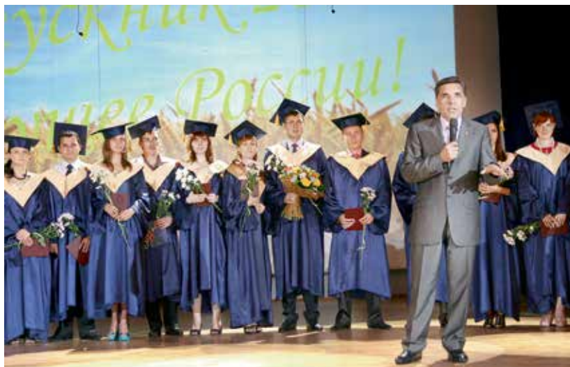
Выпускники ОГАУ 2011 года. Красные дипломы за отличную учёбу им лично вручал ректор учебного заведения.