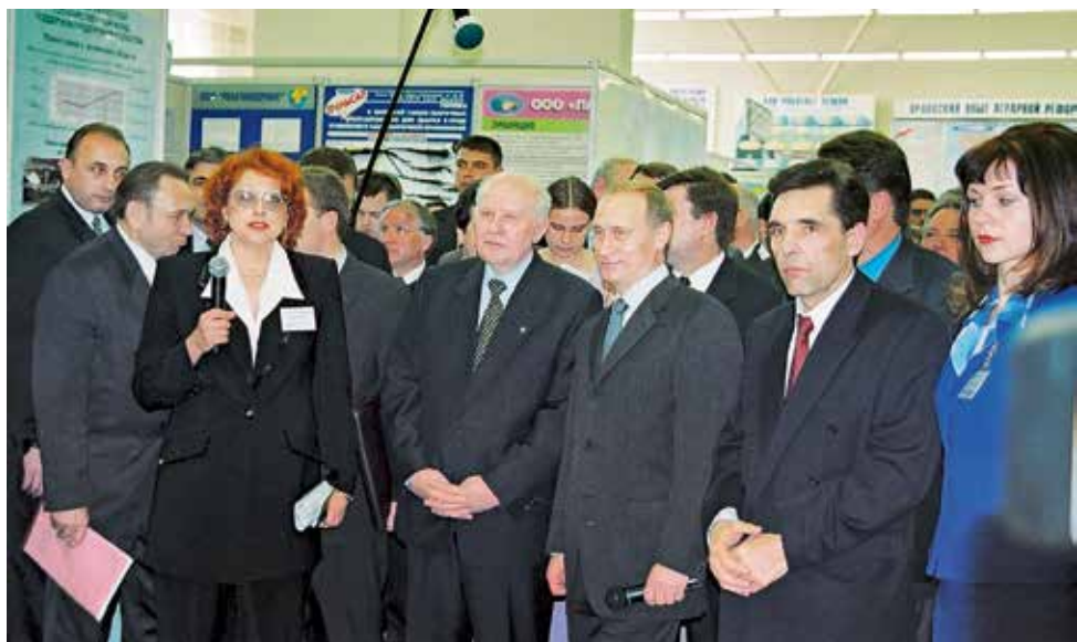
В демонстрационно-выставочном центре ОГАУ состоялся большой разговор о земельной и аграрной реформе.