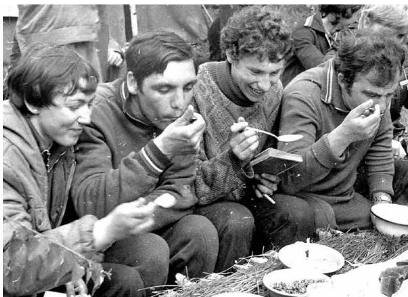
Нет ничего вкуснее студенческой каши!