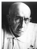
Василий Робертович ВИЛЬЯМС (1863–1939 гг.) – выдающийся российский и советский учёный, академик Академии наук СССР, создатель травопольной системы земледелия, автор многочисленных трудов по агрономическому земледелию.

Впоследствии именно Парахин станет по существу основоположником метода биологизации в растениеводстве, который он всесторонне обоснует и придаст ему строгое научное направление. Но, как водится, споры и дискуссии вокруг этой темы, как вообще вокруг всего нового, продолжаются. Сторонники активного применения химии в земледельческой отрасли, а за ними нетрудно разглядеть фигуры лоббистов, владеющих огромными мощностями по производству минеральных удобрений, не перестают утверждать, что иного пути для достижения стабильных урожаев в современном мире не существует. Но это не так.