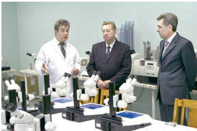
В лаборатории и в поле.