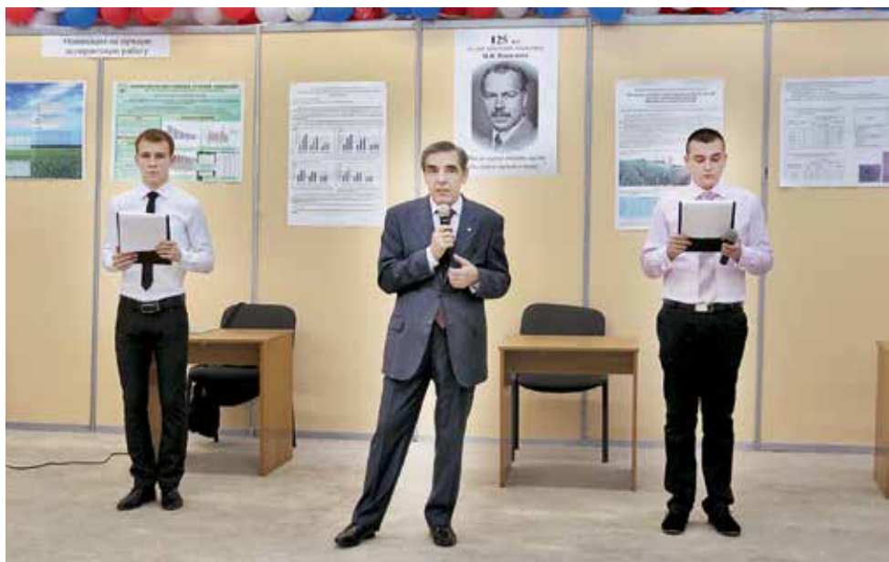
Студенческие, аспирантские конкурсы – неотъемлемая часть образовательного процесса в ОГАУ, сложившегося при Парахине.