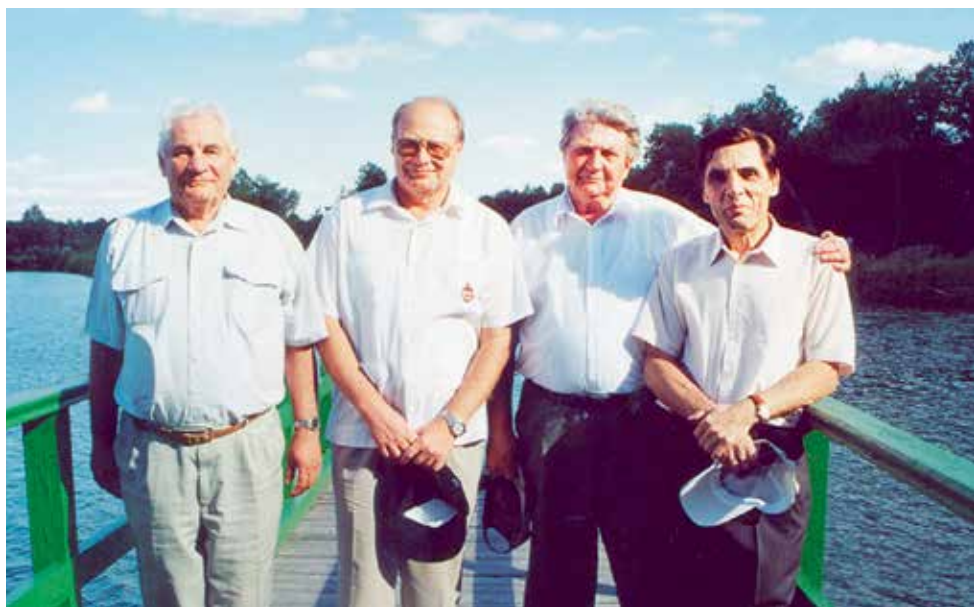
На озере. С коллегами из Российской академии наук.