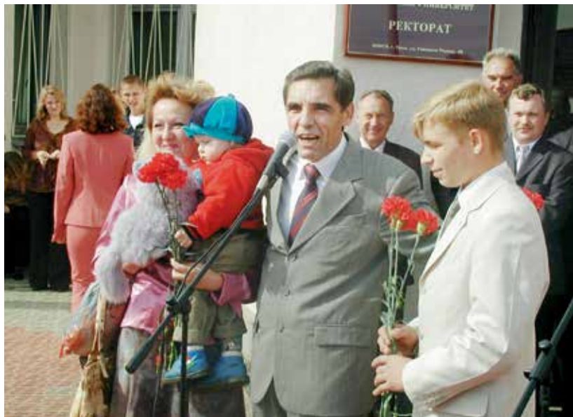
Студенческие семьи – радость для всех!

это священная книга ОГАУ. Воспитанный на высочайшем уважении к учителю, который был в деревне самым почитаемым человеком, Парахин требует такого же отношения к преподавателям и сейчас.