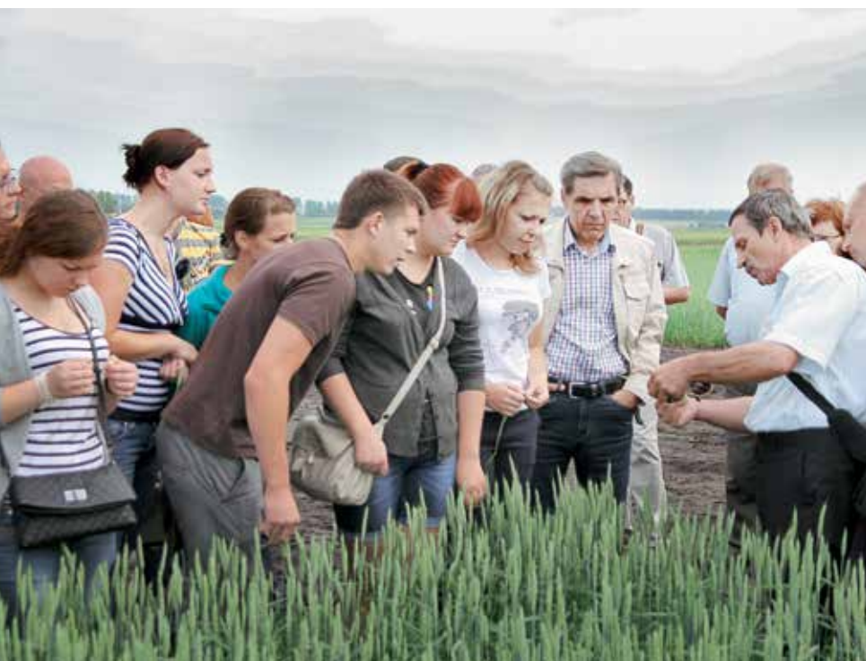
Студенты и преподаватели агрофака ОГАУ на практических занятиях.