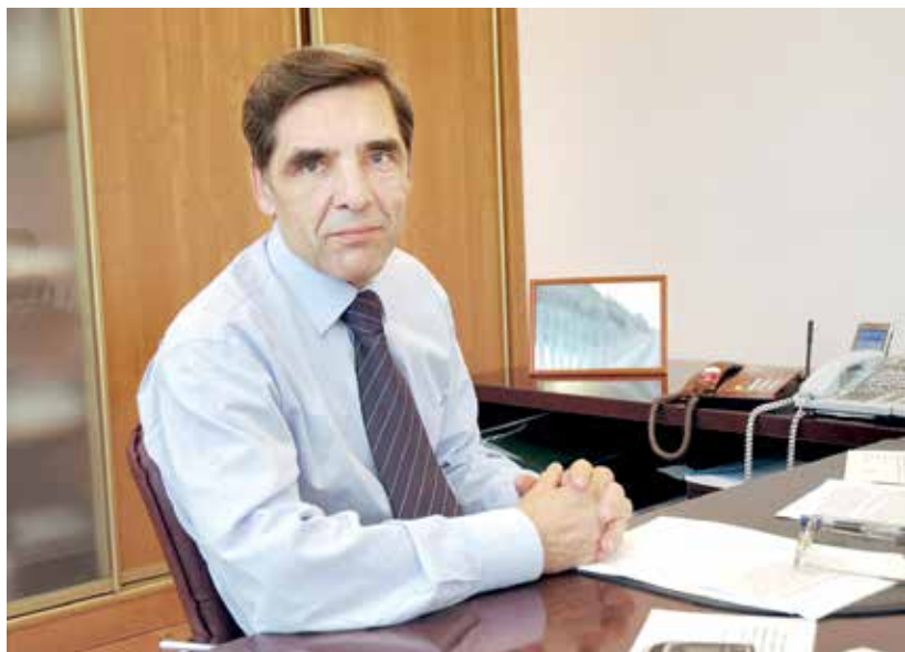
В рабочем кабинете.