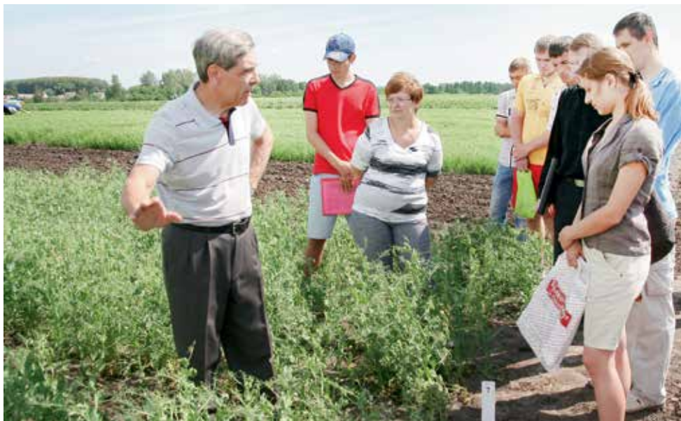
На этом участке – новый, перспективный сорт гороха.

мы, которые есть в плодородном слое, и сами растения могут от этого страдать.