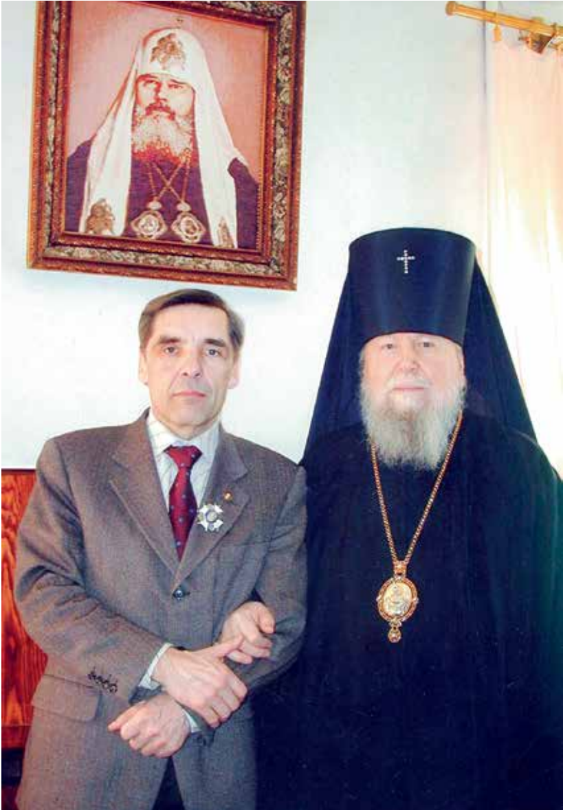
Владыку Паисия можно смело назвать духовником академика Парахина.