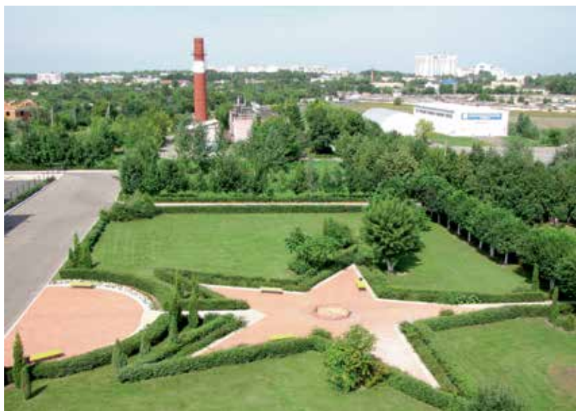
Оригинальные «сюжеты» парковой зоны.