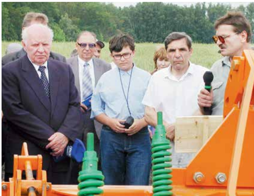
Осмотр новой техники.

торые не относились к разряду ключевых и без которых вполне можно было обойтись. Главнауки при всей своей значимости в вопросах финансирования как раз и относилось к числу таких – не первостатейных.