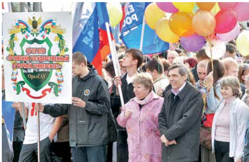
В праздничной колонне.