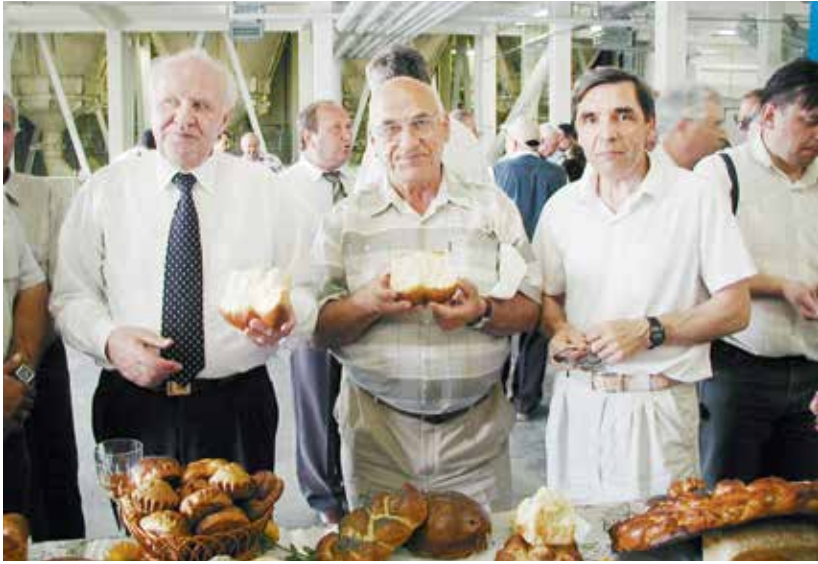
Спору нет: орловский хлеб самый вкусный!