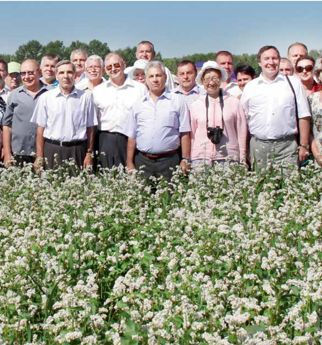
«День поля» в Шатилово.