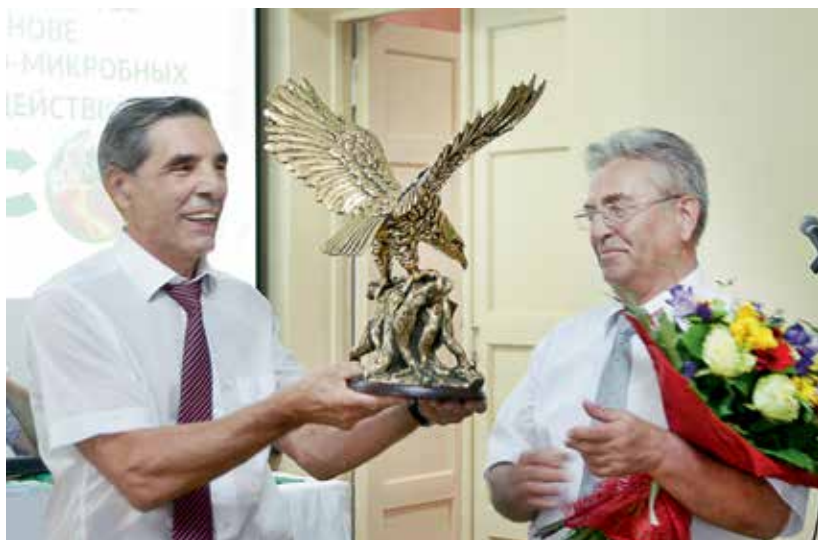
Подарок большому ученому В. И. Зотикову.

ли, ему завидовали, порой пытались вывести из равновесия, но в спину никто не плевал. И если сам он вступал с кем-то в спор, то делал это открыто, не таясь.