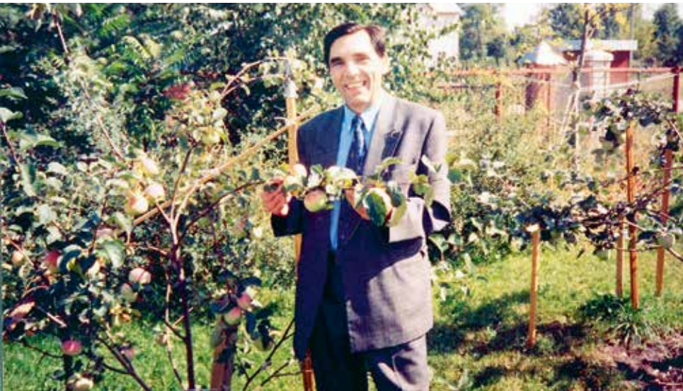
Какие яблоки! Они могли вырасти только на участке академика.