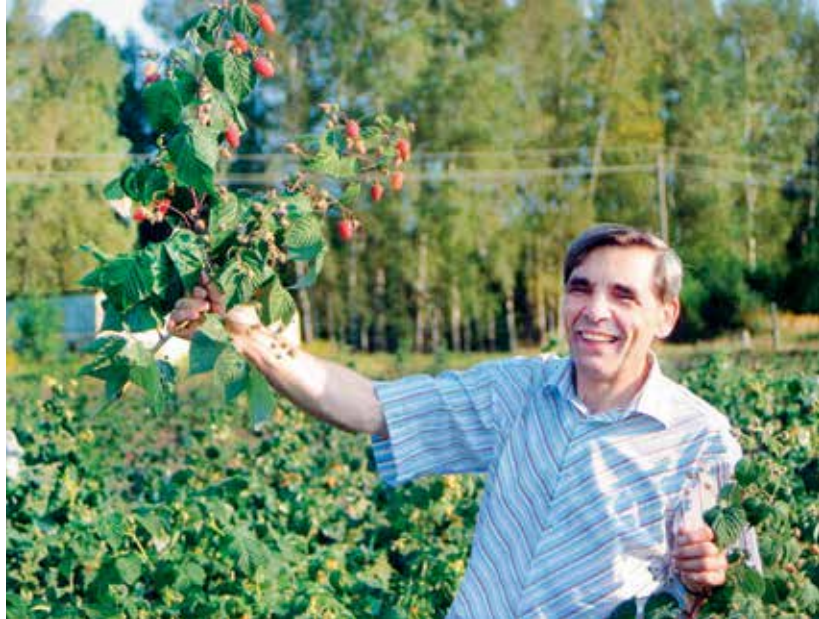
Вкусна и красива ягода малина.