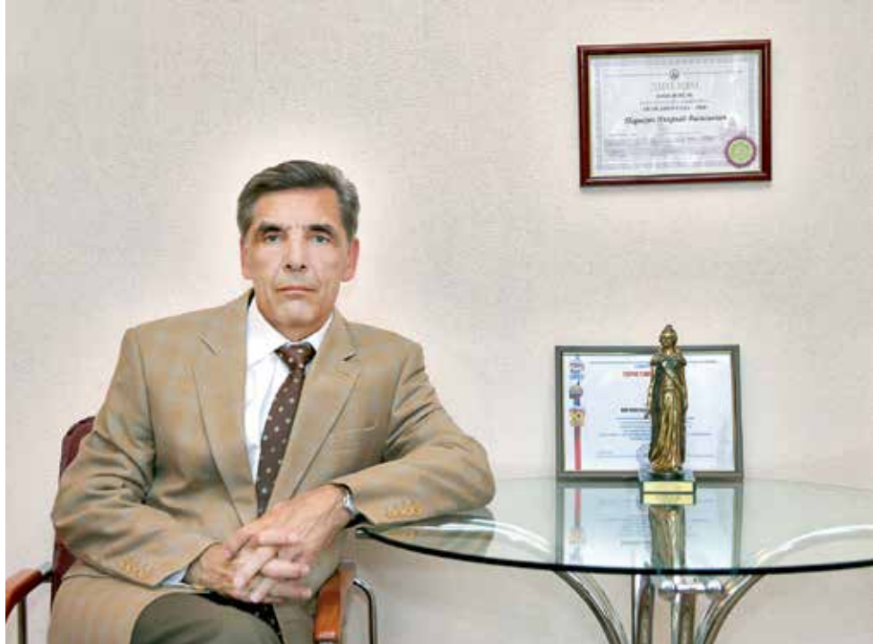
Только что получил ещё одну заслуженную награду.