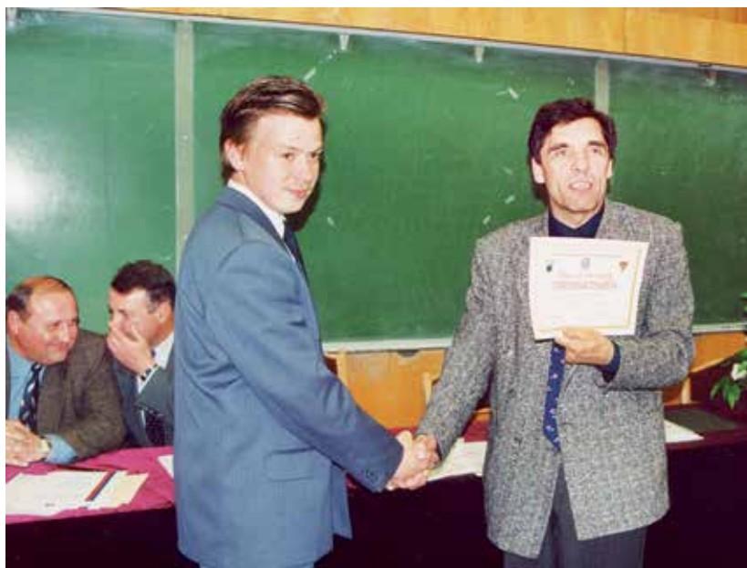
Почётные грамоты не каждому студенту дают – только по заслугам!