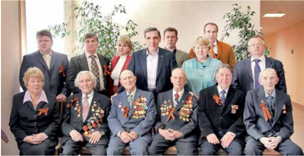
С ветеранами Орловского аграрного университета.