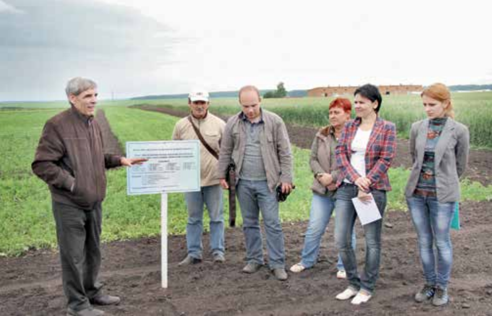
На этих участках отрабатывались экологически безопасные методы выращивания сои.