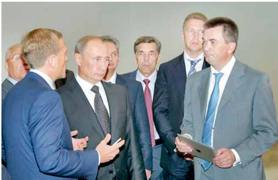
Важный разговор с президентом.

где он выступал одновременно в качестве организатора и основного докладчика. Подчеркнём, это были международные и все-российские конференции, симпозиумы, совещания по самым актуальным вопросам развития аграрного сектора и научных исследований. В их числе – Международная практическая конференция «Кормопроизводство в условиях XXI века: проблемы и пути решения» (г. Орёл, 12–13 марта 2009 г.); Международная научно-практическая конференция «Состояние и перспективы энерго- и ресурсосберегающих технологий в АПК» (г. Орёл, 24–26 марта 2009 г.); выездное заседание Президиума Россельхозакадемии «Роль генетических ресурсов и селекционных достижений в обеспечении динамичного развития сельскохозяйственного производства», «День поля» и 3-я ярмарка сортов на Шатиловской СХОС (8–9 июля 2009 г.); Международная научно-практическая конференция «Интенсификация и оптимизация производственного процесса сельскохозяйственных растений (г. Орёл, 6–8 октября 2009 г.); всероссийская научно-