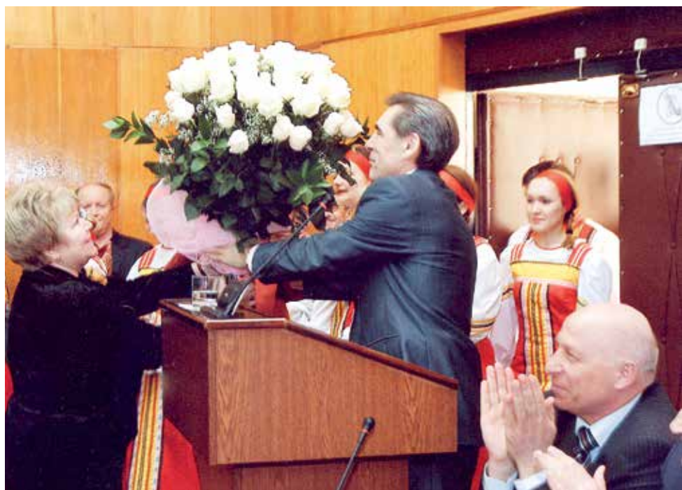
Цветы на юбилей ректору.