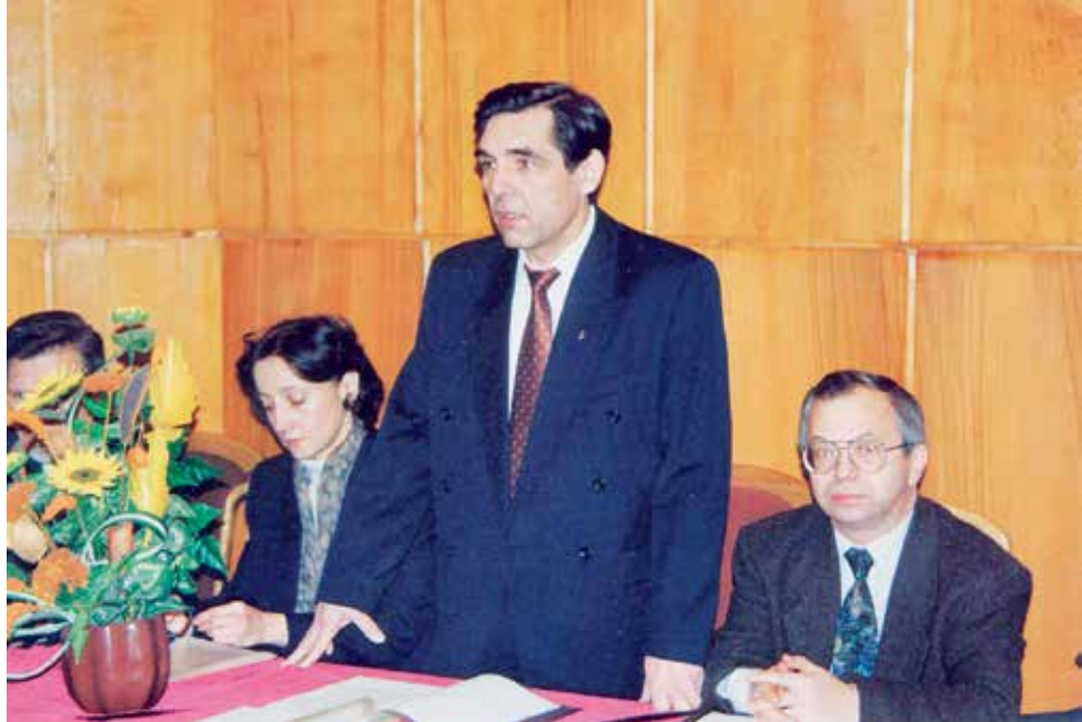
На заседании совета по межвузовскому зарубежному сотрудничеству.