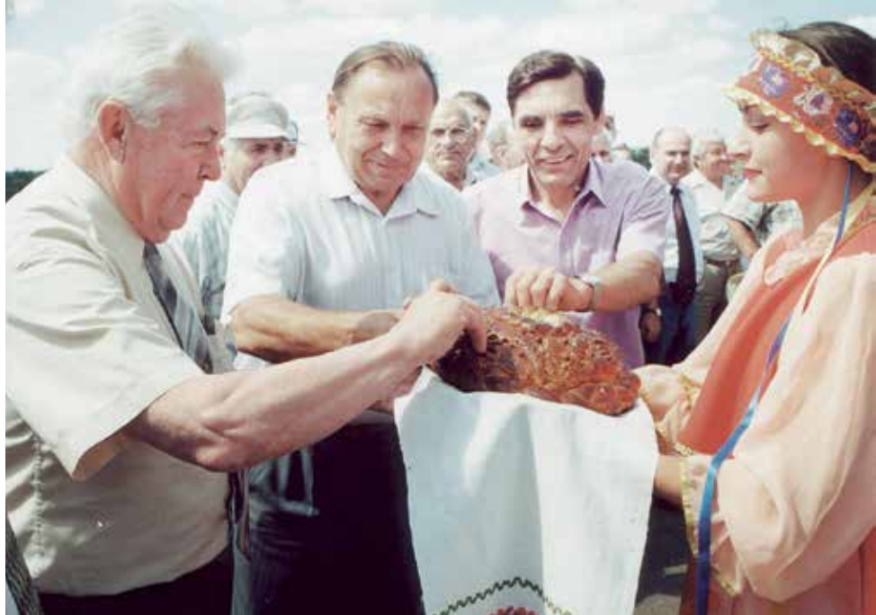
По традиции гостей нашего города встречают хлебом-солью.