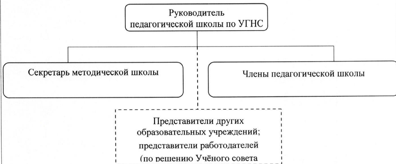
Рисунок 2 – Структура педагогической школы по УГНС