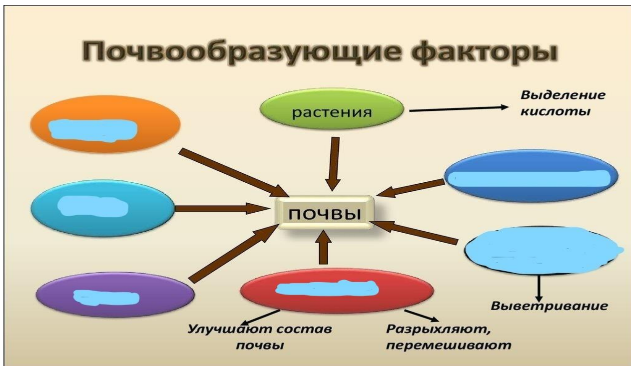
Схема 3- Почвообразующие факторы