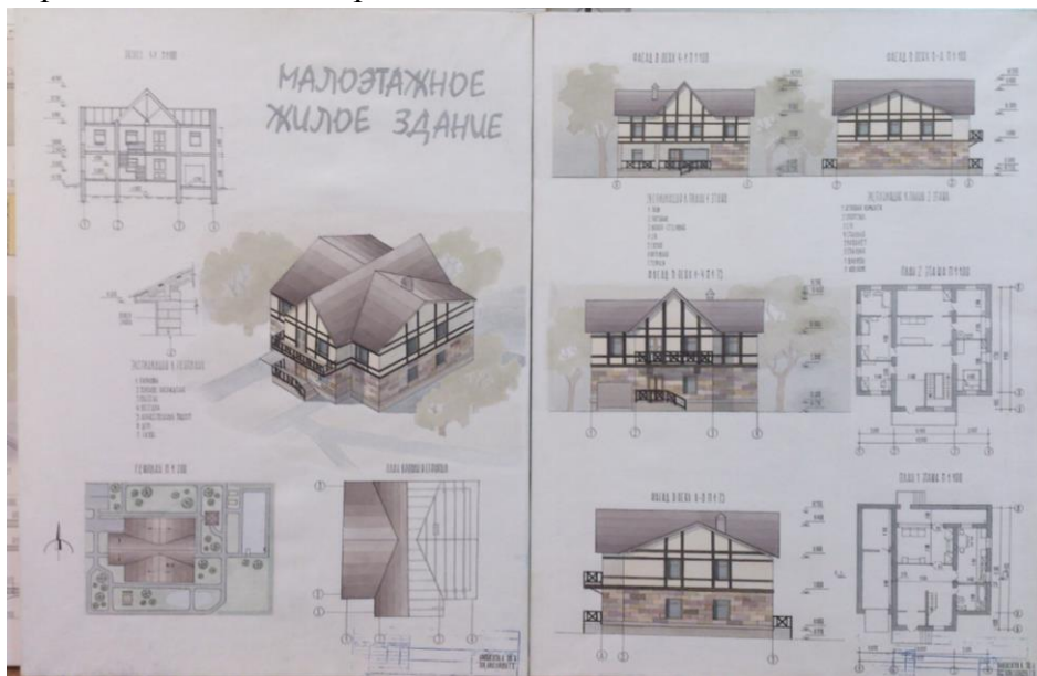
Рис. 1 Вариант оформления подачи проекта, выполненного вручную

Утверждение эскизов цветовой подачи проекта. Окончательное графическое оформление всех чертежей и надписей проекта