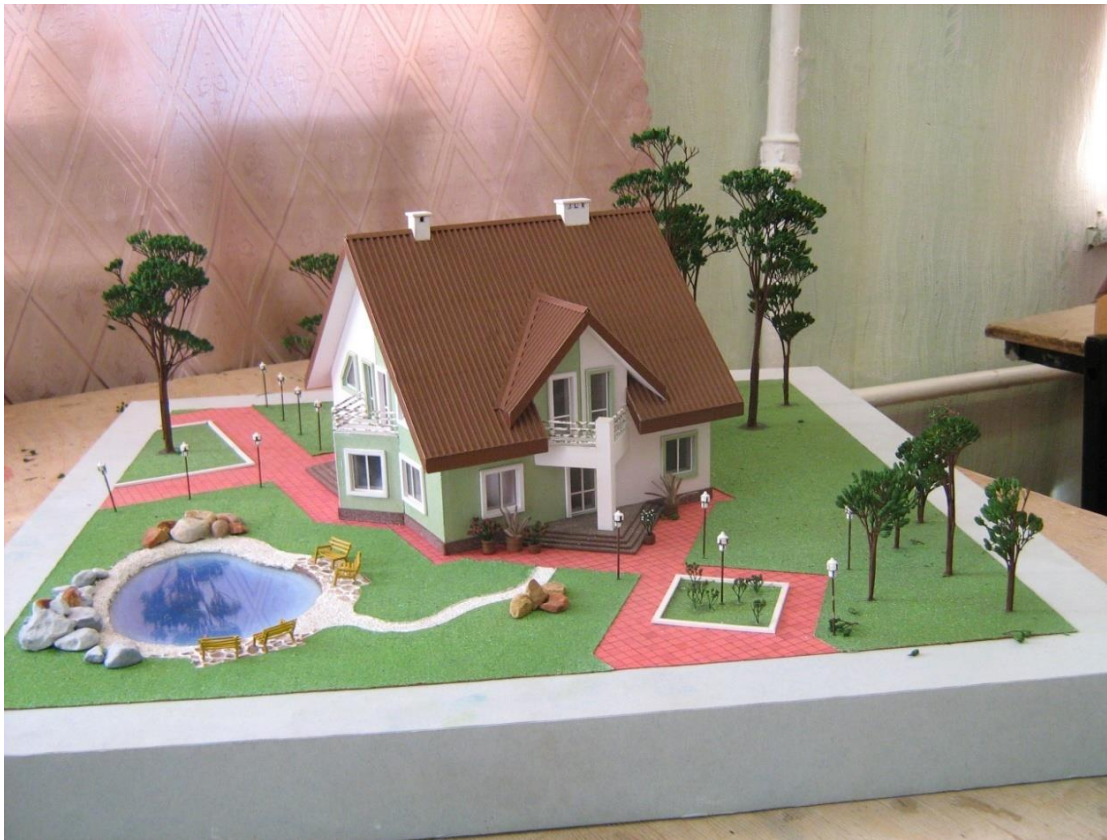
Рис.1. Студенческая работа, макет малоэтажного жилого здания.