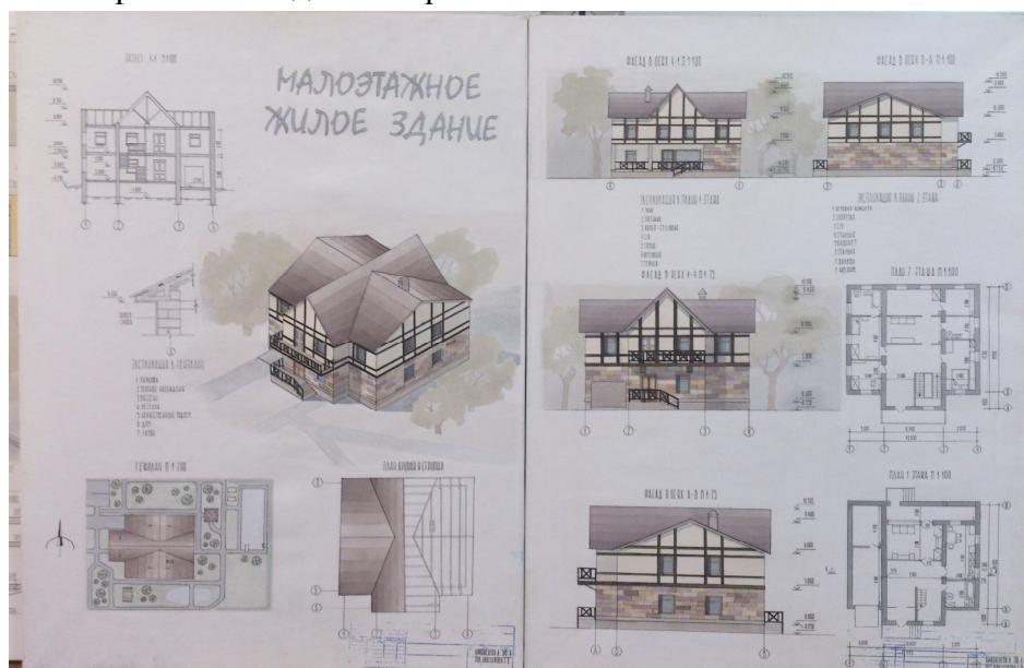
Рис. 1 Вариант оформления подачи проекта, выполненного вручную

Утверждение эскизов цветовой подачи проекта. Окончательное графическое оформление всех чертежей и надписей проекта