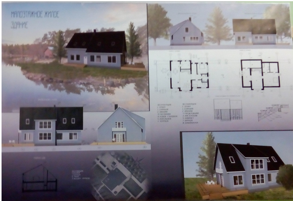
Рис. 1 Вариант оформления подачи проекта выполненного с применением автоматизированной системы проектирования - ARCHICAD